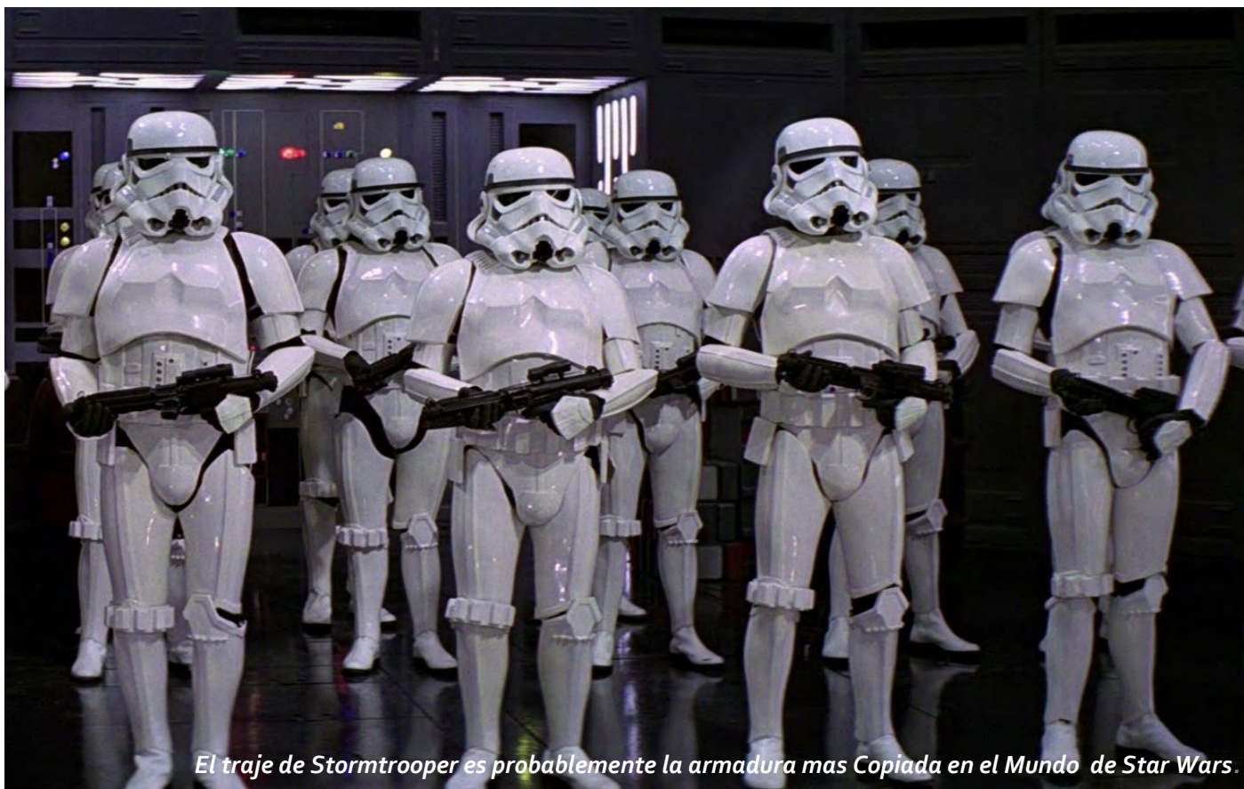
El traje de Stormtrooper es probablemente la armadura mas Copiada en el Mundo de Star Wars.